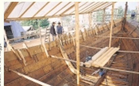
Bouw van de kogge

Hoe en wanneer Kampen ontstaan is, daarover bestaat geen zekerheid en ook het document waarin het onomstotelijke bewijs van de Kamper stadsrechten wordt geleverd, is zoekgeraakt. Maar zeker is dat Kampen vanaf de twaalfde eeuw in snel tempo het oudere Deventer heeft overvleugeld als handelsstad. De IJssel was de verbinding tussen het Rijnland en de Oostzeehavens en Kampen was een tijd lang de belangrijkste (en grootste) stad van de Noordelijke Nederlanden. Ter illustratie: Kampen telde rond 1400 zo'n 12.000 inwoners, het toen nog nietige Amsterdam 5.000. De verklaring voor de Kamper bloeitijd moet gezocht worden in de strategische ligging van de stad bij de monding van de IJssel, waar ook de grotere koggeschepen moeiteloos konden aanleggen en overladen. Maar ook de handelsgeest van de Kamper schippers, die met veel lef in den vreemde opereerden, was een belangrijke factor.